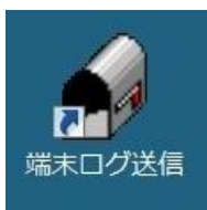
(端末ログ送信アイコン)