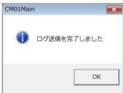
(ログ送信完了メッセージ)

以上で、端末ログ送信処理は終了です。ご不明な点等があれば、遠慮なく約確センタへお問い合わせください。